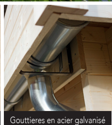
Gouttières en acier galvanisé