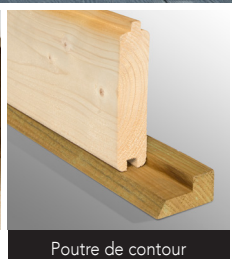
Poutre de contour