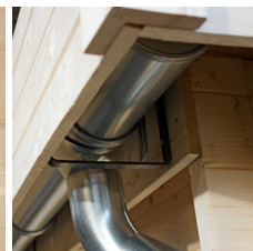
Gouttières en acier galvanisé