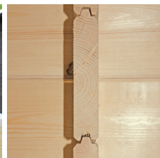
Parois épaisseur 28 mm