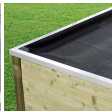
Couverture en EPDM