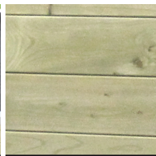
Bois traité autoclave