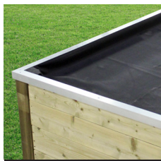
Couverture en EPDM