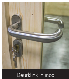
Deurklink in inox